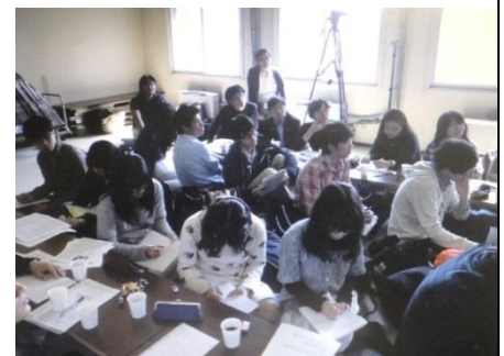
熱心にメモを取る学生たち