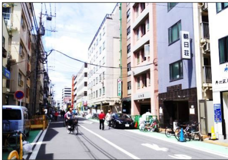
簡易宿泊所のビルが立ち並ぶのが今の寿町の風景。住民の約9割が生活保護受給者

横浜生まれの筆者は、小学校の遠足で朝、貸し切りバスの車窓から、桜木町の横浜職業安定所に港湾荷役などの日雇い仕事を求める大勢の労働者の姿を目撃したことがある。当時の横浜港は、ハシケが行き交い、停泊中の貨物船からハシケに穀物をザーと流し込むなど多くの日雇い労働者が活躍していた。「日本三大寄せ場」と言われた「寿町」が簡易宿泊所街になったのは、米軍の接収が解け、安定所がここに移った昭和30年代以降である。だが、港湾荷役の仕事は次第に減少し、1983年には、野宿する労働者を少年たちが襲撃し殺害した「横浜浮浪者襲撃事件」が起こった。筆者が朝日ジャーナル記者として取材したこの事件をきっかけに、高齢化する日雇い労働者、野宿生活者の命と暮らしをどう守るかが、社会と行政の課題としてクローズアップされたのであった。