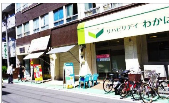
ビル1階には、介護福祉関係の事業所が軒を連ねている。寄せ場機能を失い今は「福祉の街」である